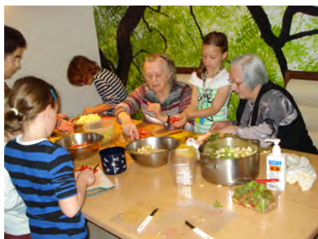
Priprava skupne malice