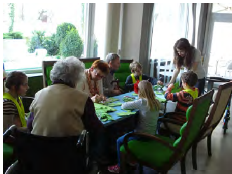
Jagode za mamice