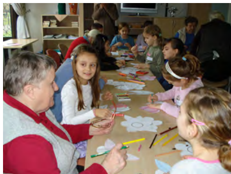
Prišla je pomlad