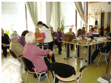
Nekoč in danes